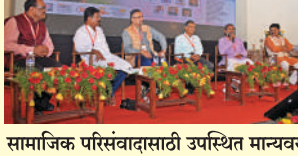
सामाजिक परिसंवादासाठी उपस्थित मान्यवर