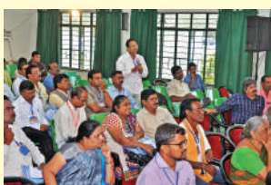
शैक्षणिक चर्चासत्र व सामाजिक परिसंवादासाठी उपस्थित जनसमुदाय