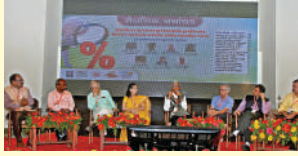
शैक्षणिक चर्चासत्रासाठी उपस्थित मान्यवर